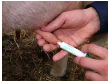
Orbesealer sprøjtes ind i pattekanalen

Forsøget på KFC skal afklare, hvor godt præparatet modvirker yverbetændelse, og finde indikatorer for, hvilke køer, der med størst fordel, kan behandles.