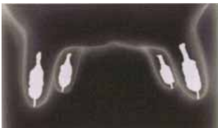
Røntgenbilledet ovenfor viser, hvordan orbesealer lukker patten indefra.

Orbesealer behandling består i, at en voksopløsning sprøjtes ind i patten umiddelbart efter sidste malkning ved afgoldning. Dette vil hindre, at udefra kommende bakterier trænger ind.